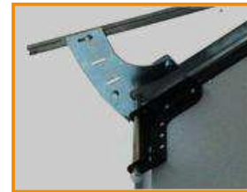
Направляючий трек відкривання на 180°

Ворота SMART доступні в комбонуваннях панелей 2+2, 2+1, 2+0, 1+1. Складання панелей нна 90° (стандарт) та 180° (опція).